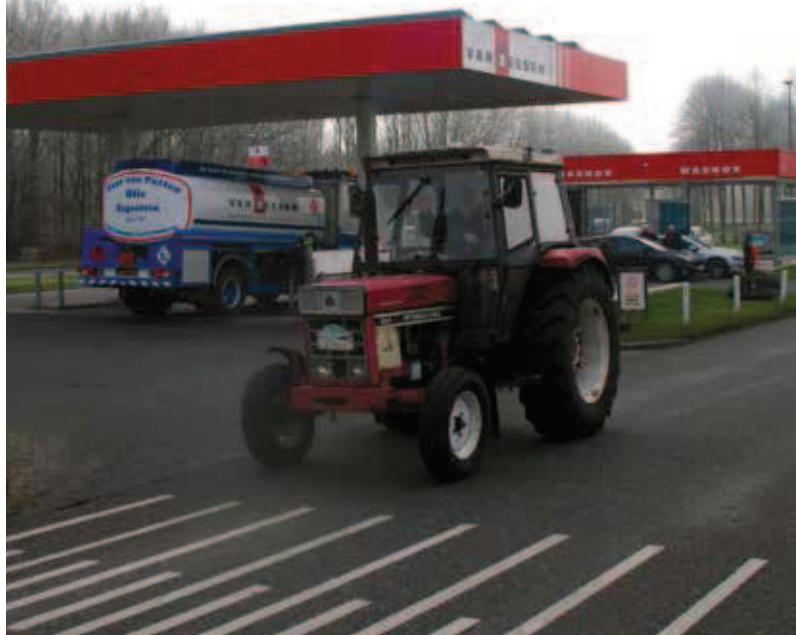
Roel de With in zijn woon-werk auto.

vel: zijn eerste kleinkind van ruim een jaar oud heeft zijn leven 'compleet en totaal veranderd'. Zij krijgt inmiddels soort van pianoles van opa die toetsenist is in een seventies coverband die 'vette rock' speelt. Waarom ellende opzoeken, als het privé en zakelijk zo lekker loopt?