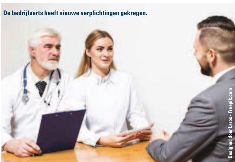
De bedrijfsarts heeft nieuwe verplichtingen gekregen.